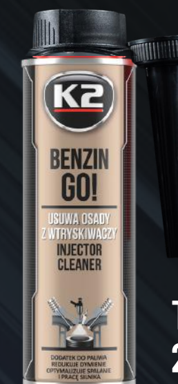
T322 BENZIN GO! 250ML