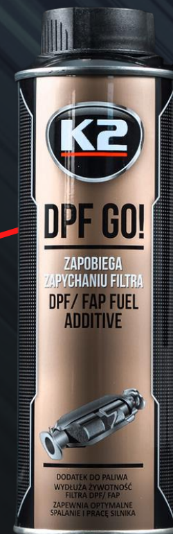
K2 DPF GO! 250ML (T319)