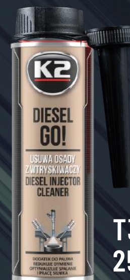
T321 DIESEL GO! 250ML