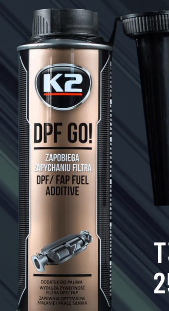
T319 DPF GO! 250ML