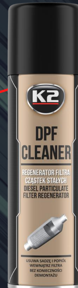
K2 DPF CLEANER 500ML (W150)