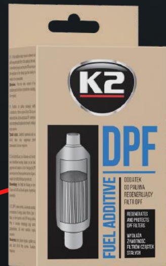
K2 DPF 50ML (T316)