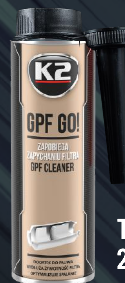
T318 GPF GO! 250ML