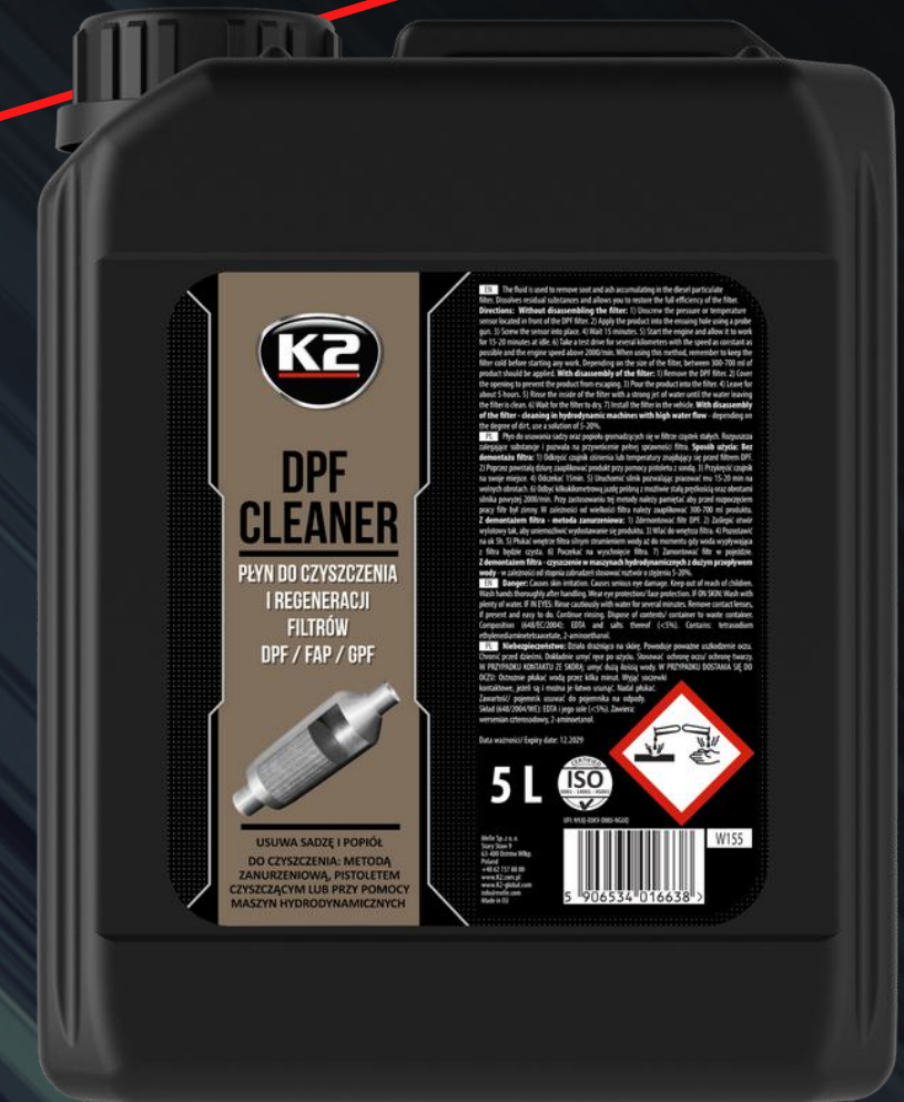
K2 DPF CLEANER 5L (W155)